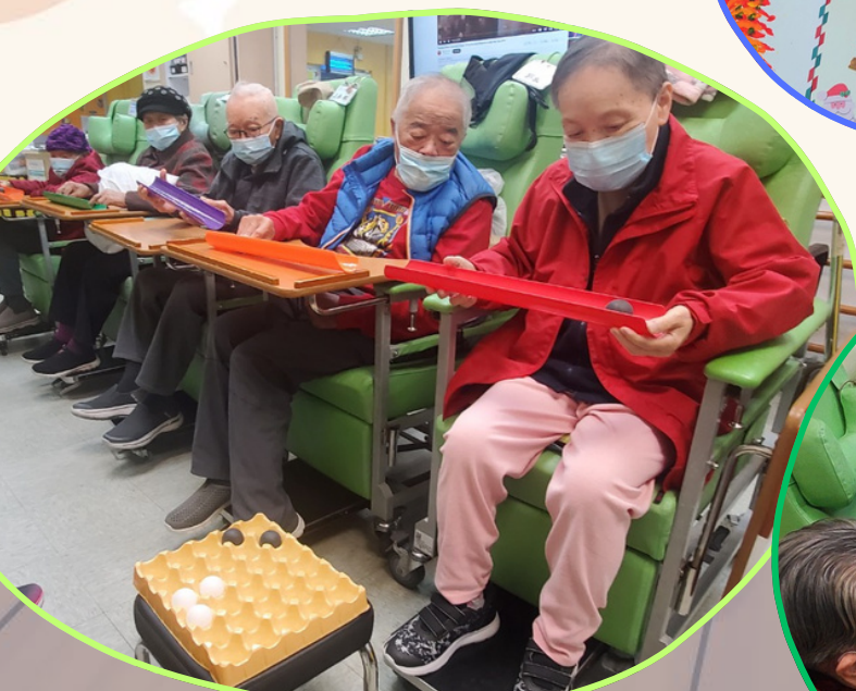
日間中心集體遊戲