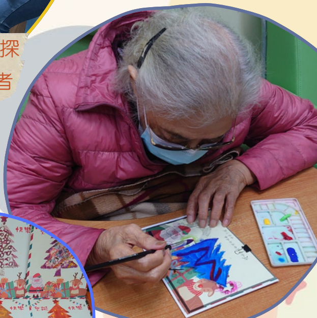
聖誕手作送暖活動