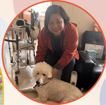
青少年及狗義工探訪獨居/雙老長者