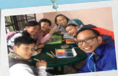
參加者到戶外考察呢