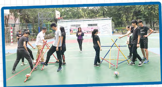
● 基督書院 - 學生會領袖訓練營