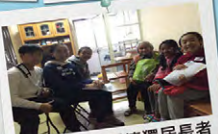
一起送暖，關懷獨居長者