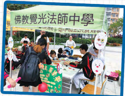
● 佛教覺光法師中學 - 中五義工服務