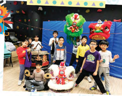
隊員年紀小小，卻能舉起威風凜凜的獅頭，伴隨節奏舞動起來！