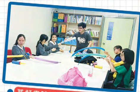
● 基督書院 - 讓愛傳開去