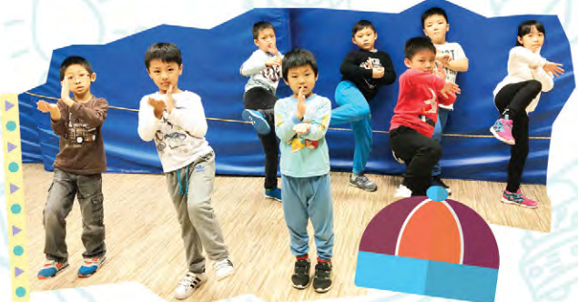
小師父耍出獨特的詠春拳，氣勢如虹，不可輕看！