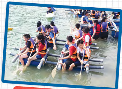
● 沙田崇真中學 - 高中領袖訓練