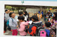
化身地區小记者，訪問街坊意見