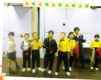
平時喜歡跳跳紮紮的小朋友，各式各樣的雜技都難唔到佢地啊！