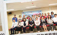
獲得學校老師、贊助商見證結業

中心於2016-2017年度推行第二屆「TTM好學生獎勵計劃」。本屆蒙贊助商以及個人名義慷慨捐助下，可供參加名額增至十五人，使更多在學業、音樂、運動及藝術方面有良好表現的「好學生」受惠。本計劃期望參加者能關懷弱勢社群，服務社區，幫助他們建立正面的價值觀及自我形象。