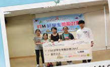
順利完成計劃，每人獲得獎學金$1,000