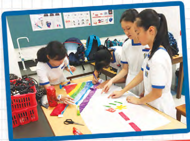
● 沙田崇真中學 - 初中領袖訓練