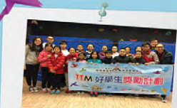
參加者第一次見面

為鼓勵區內學生在學業、音樂、運動及藝術等方面皆有良好表現的好學生關心弱勢社群、服務社區。藉此幫助學生建立正面的價值觀及自我形象。