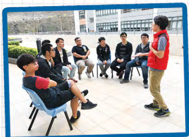
● 明愛專上學院 - 遊戲帶領課程