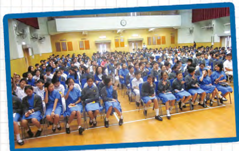
● 大埔救恩書院 - 好心情計劃