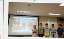
參加者分享對整個計劃的感受