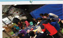
合力製作一本義工服務回憶錄