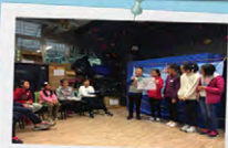
探訪服務前的準備，他們表現很認真