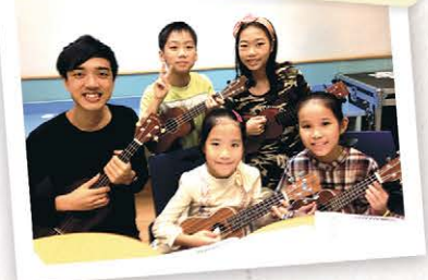
我是小小音樂家，一齊欣賞我們表演夏威夷小結他啦！