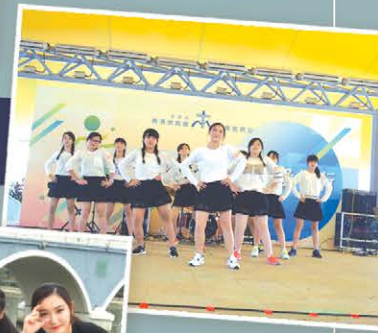
本機構55周年「真·愛同行」@沙田中央公園結客場