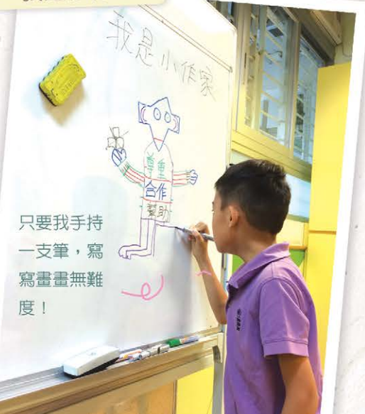
只要我手持一支筆，寫寫畫畫無難度！