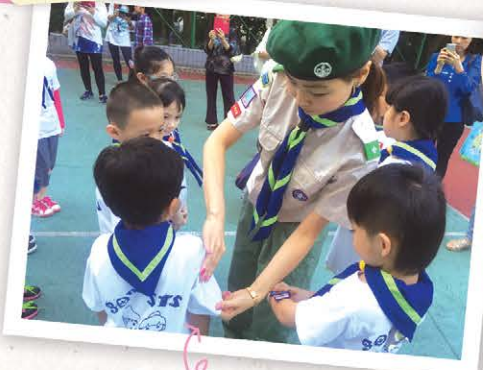
我願參加小童軍！愛神、愛人、愛國家！