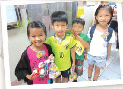
一年容易又中秋，今年小童軍和家人繼續一齊做義工、慶中秋，到區內探訪獨居長者。我哋準備好喇！你呢？