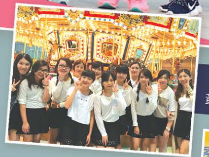
「社區舞蹈推廣計劃」- 黃昏藝薈@馬鞍山廣場

CAMSKY是由一班熱愛KPOP的中學組成，大部分參加者均為初學者。她們亦把組合名為「CAMSKY」，即為同一天空下的意思，以舞蹈燃亮生活色彩，盡展潛能。她們亦於11月下旬參與本機構55周年「真·愛同行」活動及「社區舞蹈推廣計劃」等公開表演，她們的努力獲得師長、家人和朋友認同和肯定。