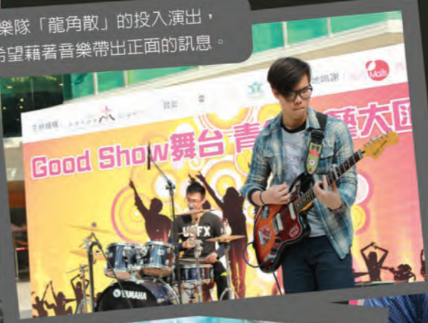
樂隊「龍角散」的投入演出，希望藉著音樂帶出正面的訊息。

「GOOD SHOW舞台」今年於置富第一城(中庭位置)舉行，當日氣氛熱鬧，場面壯觀，吸引不少途人駐足觀看，現場的觀眾對大匯演反應良好，更有觀眾邀請青少年拍照留念。當天出席的家長、朋友及導師對於青少年的表演及成長都表示讚賞及肯定他們過去數月付出的努力。