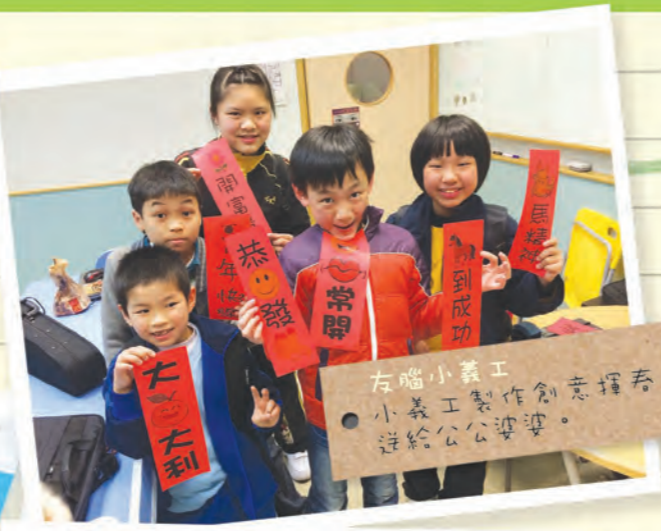
左腦小義工 小義工製作創意揮春 送給公公婆婆。