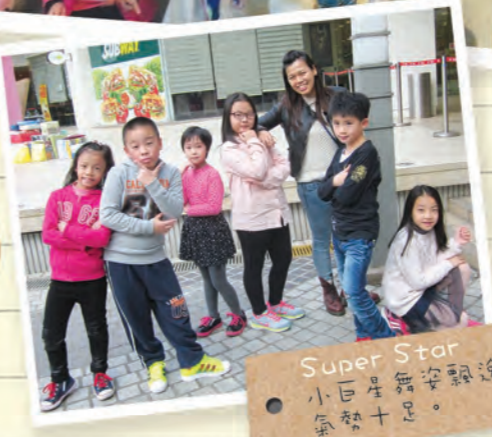
Super Star 小巨星盡享飄逸， 氣勢十足。