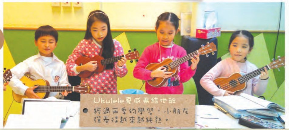
Ukulele夏威夷結他班 經過兩季的學習，小朋友 彈奏得越來越純熟。