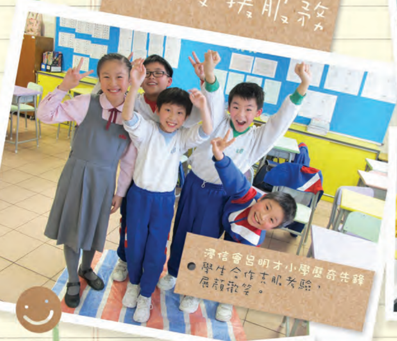
滑信會呂明才小學歷奇先鋒 學生合作志願考驗， 展顏歡笑。