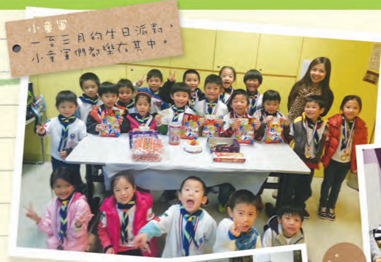
小童軍 一月三月的生日派對， 小童軍們都樂在其中。