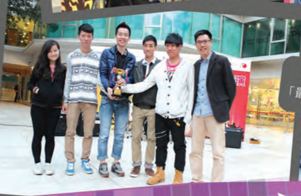
樂隊「X-FORCE」奪得「最受歡迎表演隊伍」的獎項