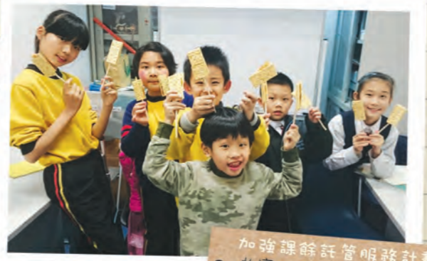
加強課餘託管服務計劃 做完功課，一起開心製作 夾牙糖。