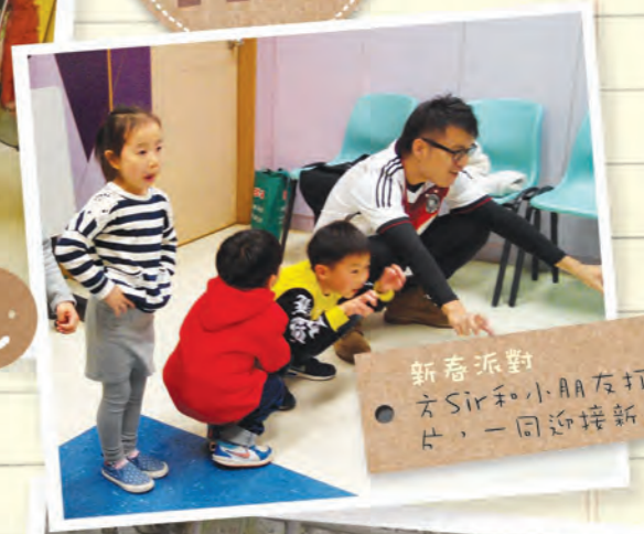
新春派對 方Sir和小朋友打成一 片，一同迎接新年。