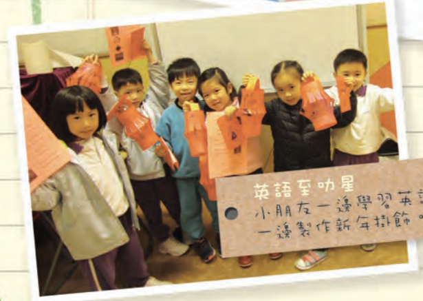
英語至叻星 小朋友一邊學習英語， 一邊製作新年掛飾。