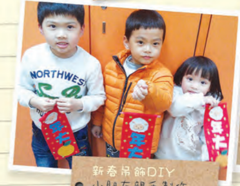
新春吊飾DIY 小朋友親手製作 吊飾，喜氣洋洋。