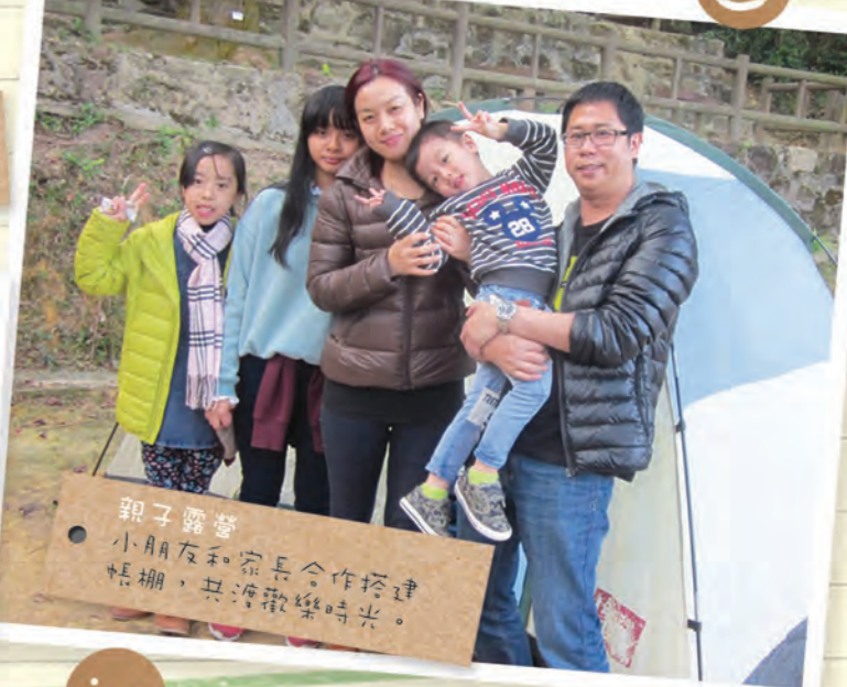
親子露營 小朋友和家長合作搭建 帳棚，共渡歡樂時光。