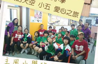
聖公會主風小學 成長的天空 小五 愛心之旅

一班參加本年度成長的天空計劃的小四同學將於三年內學習如何提升歸屬感、效能感及樂觀感。精彩旅程，由今開始！