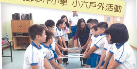
聖公會阮鄭夢芹小學 小六戶外活動