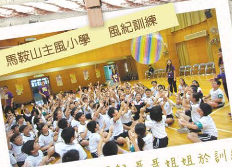
馬鞍山主風小學 風紀訓練