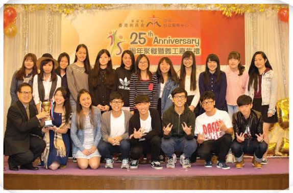
傑出義工小組 (舞道館)