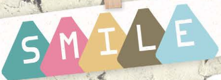
變身! Super Star