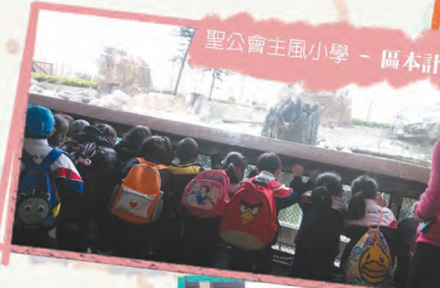
聖公會主風小學 - 區本計劃戶外學習之旅