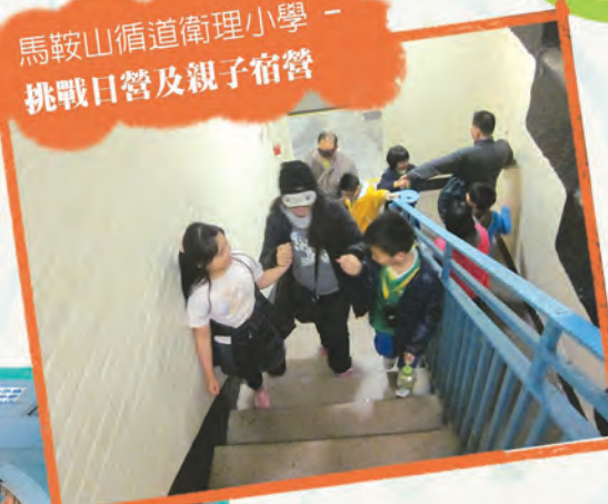
馬鞍山循道衛理小學 - 挑戰日營及親子宿營