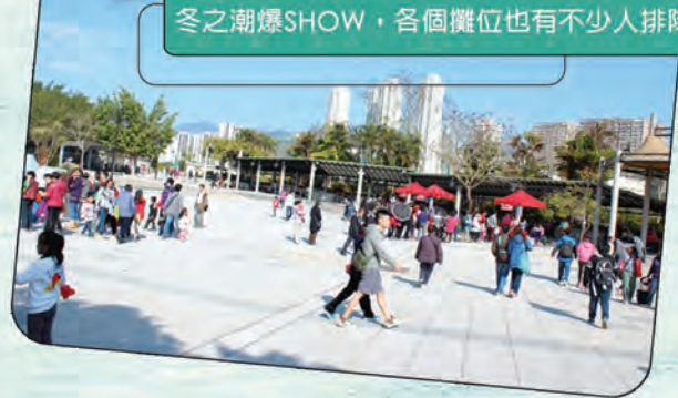
冬之潮爆SHOW，各個攤位也有不少人排隊。