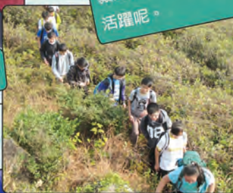
聖心書院一年一度的堅毅之旅，當日大家也很活躍呢。