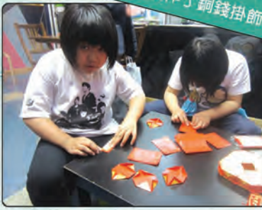
除了爆竹外，玩手指活動也製作了銅錢掛飾。