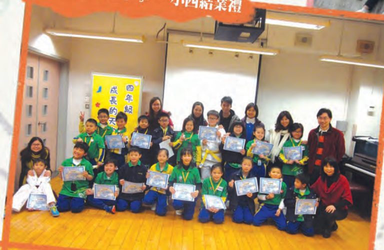
馬鞍山循道衛理小學 - 小四結業禮