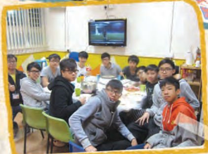
最後，大家聚在一起進行火鍋晚膳