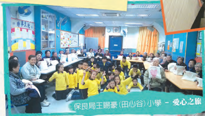
保良局王賜豪(田心谷)小學 - 愛心之旅