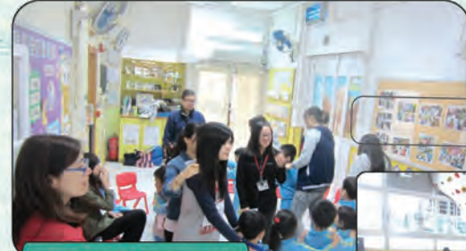
綠絲帶，義工到幼稚園和小朋友玩遊戲。