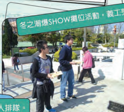
冬之潮爆SHOW攤位活動，義工努力派發遊戲券。