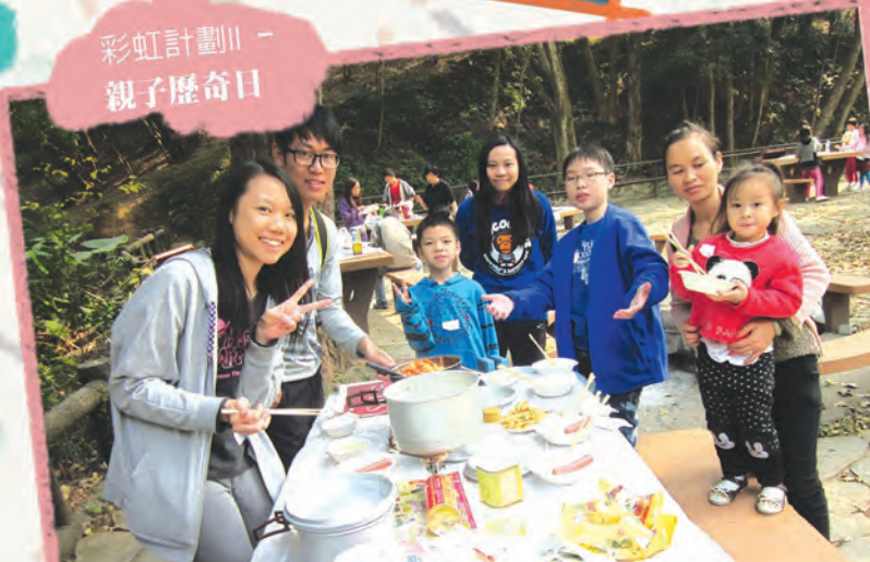
彩虹計劃II - 親子歷奇日