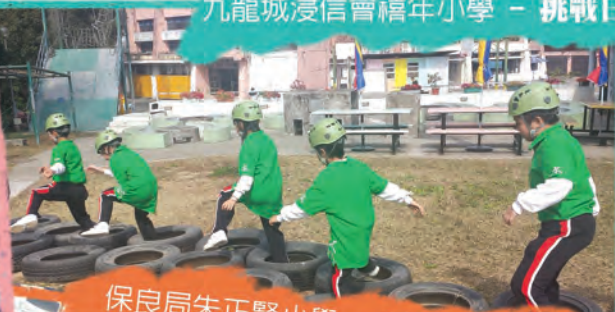
九龍城浸信會禧年小學 - 挑戰日營