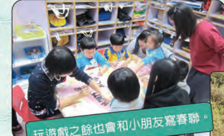
玩遊戲之餘也會和小朋友寫春聯。