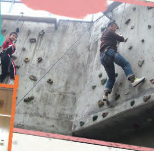
九龍城浸信會禧年小學 - 親子日營