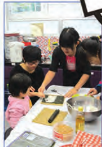
親煮樂續 FUN 第十期

內容： 親子烹飪是父母與孩子溝通或是共享家庭樂的好時機，那就讓CAFÉ的義工們為你創造玩樂的時機吧！活動將由CAFÉ的義工教授，製作簡單合時的食品。