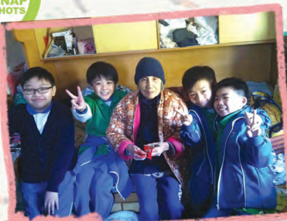
聖公會阮鄭夢芹銀禧小學 - 愛心之旅