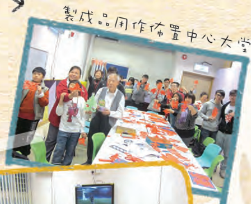
製成品用作佈置中心大堂