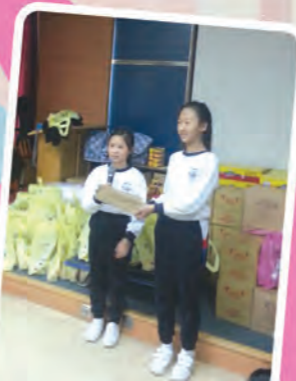
聖公會馬鞍 山主風小學 -長者探訪