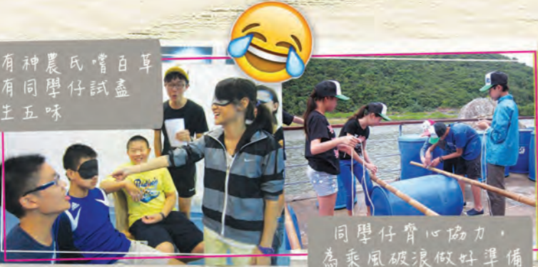
古有神農氏嚐百草，今有同學仔試盡人生五味