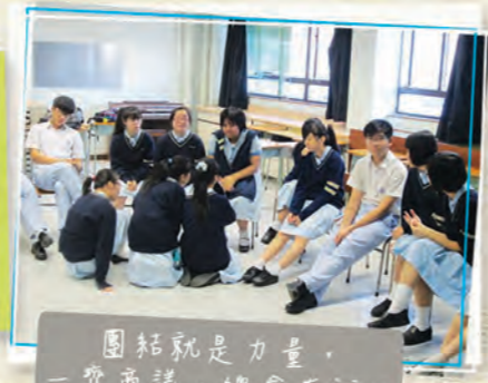
團結就是力量，一齊商議，總會有辦法