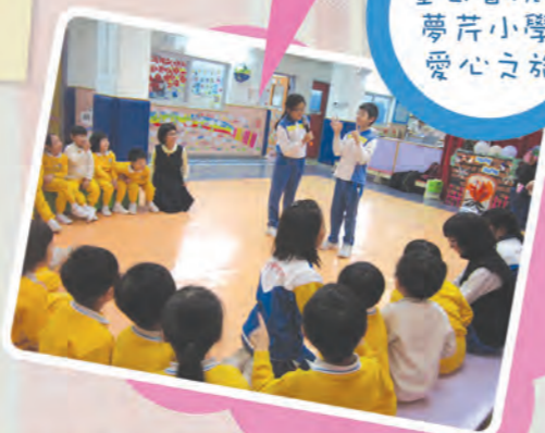
聖公會阮鄭 夢芹小學- 愛心之旅