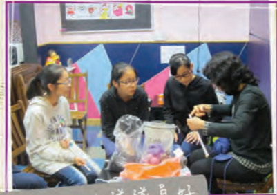
「撒冷」小隊隊員好專注，老師既示範，要給你一個讚