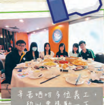
辛苦晒咁多位義工，所以要獎勵一下