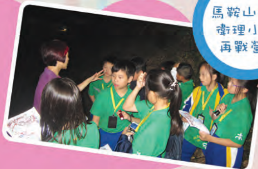
馬鞍山循道 衛理小學- 再戰營會