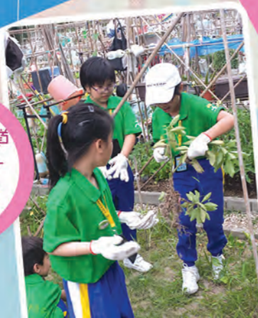
馬鞍山循道 衛理小學- 愛心之旅 (一)