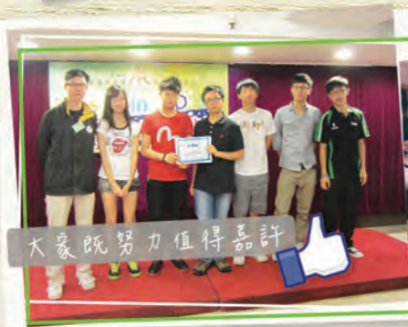
大家既努力值得嘉許