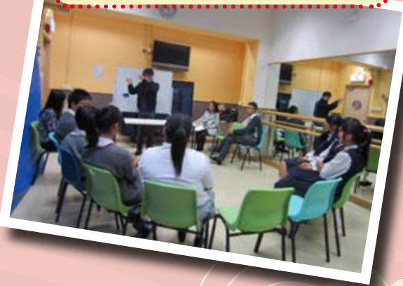
cafe 的義工專心地聆聽專業人士的分析