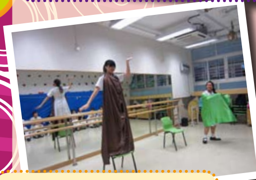
corner的演員利用布扮演不同的物件