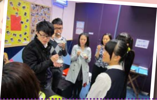
天職會計師事務所的職員向teen 天cafe的義工提供營運策略