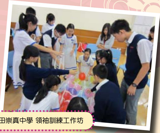
沙田崇真中學 領袖訓練工作坊