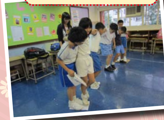
阮鄭夢芹銀禧小學 成長的天空 輔助小組