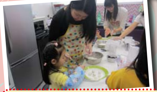
親煮樂續fun的家長與子女互相合作，製作美味的食物！