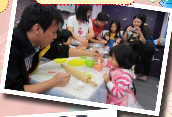
製作cafe美味的木糠布甸 ^^