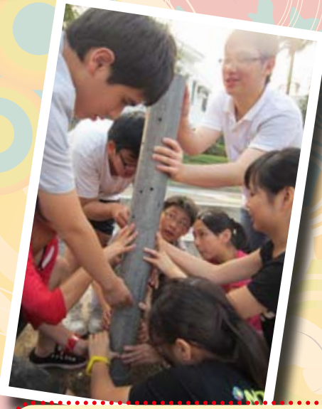
組員團結一致，即使衣服濕透了也不放手！