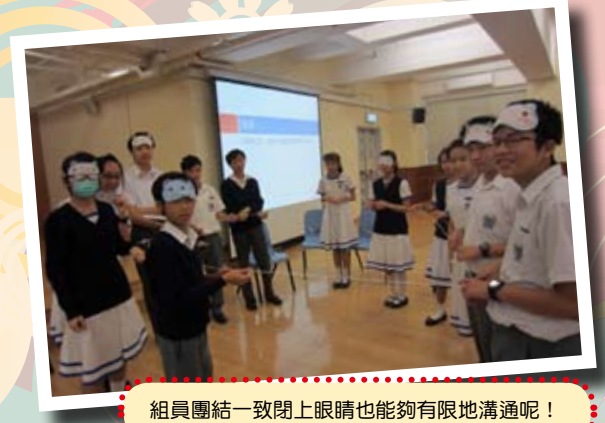
組員團結一致閉上眼睛也能夠有限地溝通呢！