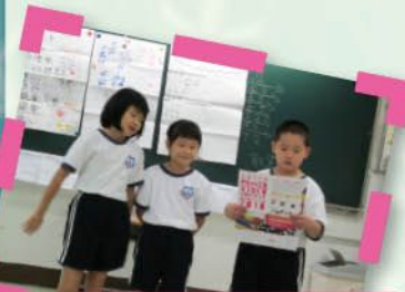
成長的天空-成長小組