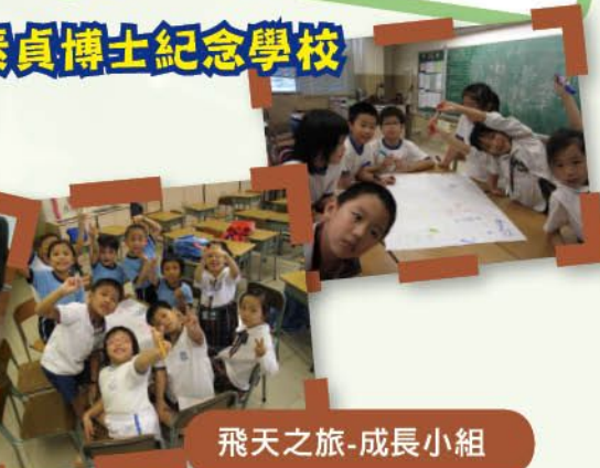
飛天之旅-成長小組