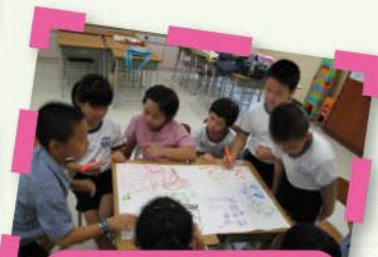
飛天之旅-成長小組