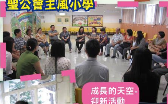
成長的天空-迎新活動