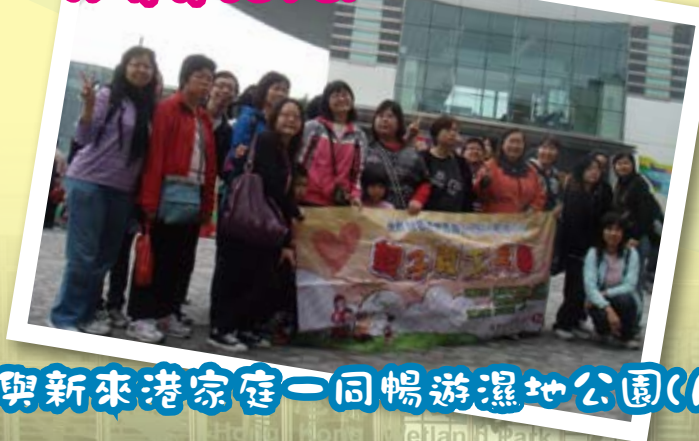
與精神病康復人士一同遊山頂 (04/3/2010)

計劃以社會上的弱勢社群，去服務社區上另一群的弱勢社群，是一個很有意義的活動，隨了達到社區共融的目標，更可提升單親家庭的自我形象；最難得是參加的親子義工都表示活動能促進他們彼此間的感情，是本計劃最成功的地方。