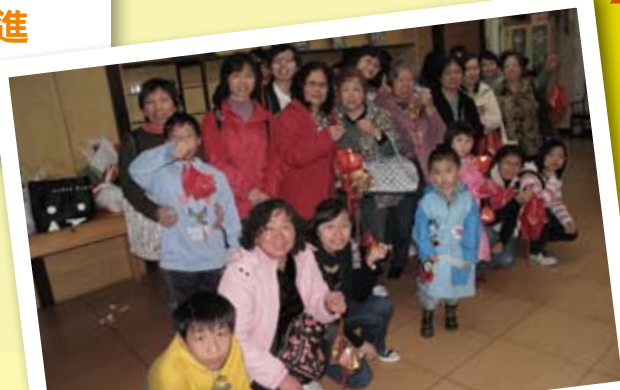
親子義工一同將賀年掛飾送給老人院舍 (7/2/2010) (7/2/2010)