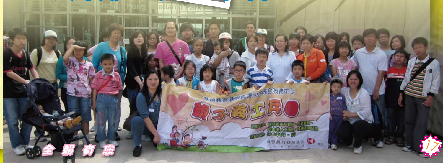
與新來港家庭一同暢遊濕地公園 (1/5/2010)