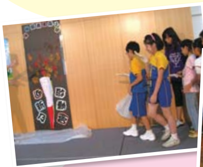
同學正進行計劃啟動儀式