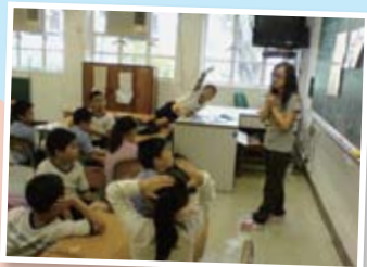
飛天之旅成長小組的情況，同學均表現投入。