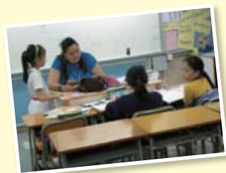
飛天之旅的導師為同學核對功課的一刻