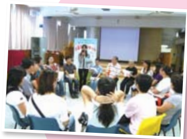
參加同學的家長進行工作坊以了解計劃內容