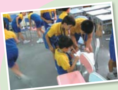
同學在社工協助下自行訂立在活動中的小組規則