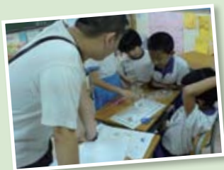
同學完成功課亦可以和同學切磋棋藝。