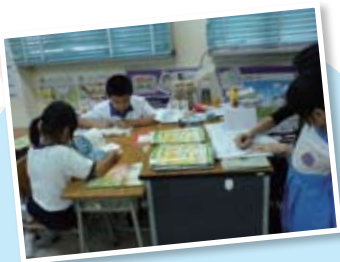
開心學堂的導師耐心教授同學功課上的疑難。

成長小組已於九月正式開始，當中分了二組，同樣透過每節不同的主題，讓同學在互動中學習與成長。主風小學的飛天之旅活動中，除了有成長小組外，還有興趣班的活動，當中包括有馬賽克、英文興趣班及魔術訓練。