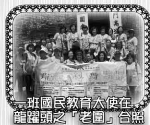
一班國民教育大使在 龍躍頭之「老圍」合照

中心於本年度成功獲得公民教育委員會贊助，舉辦「龍飛鳳舞」計劃，此計劃目的讓區內的婦女及青少年認識不同地方之本地文化，培養他們對本地文化的認同、尊重及歸屬感。此外，計劃於本年度六月份已舉行八節小組，反應十分理想，他們透過一連串的「國民教育大使工作坊」訓練三十名「國民教育大使」認識本地家鄉風土民情、生活習慣及社會風俗，例如香港歷史、圍村生活、建築、教育、盤菜及祭祀等，並透過兩次實地考察，分別參觀元朗屏山文物館、文物徑及龍躍頭，並透過專題研習，學習整理資料要訣、匯報技巧及團隊精神訓練等，務求深入了解不同本土的本地文化。