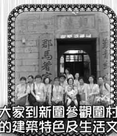
大家到新圍參觀圍村內 的建築特色及生活文化