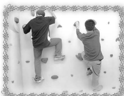
歷奇山莊(位於博康邨博達樓)