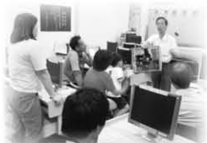
中原電腦(維修講座)

感謝中原電腦公司送贈 給我兒女一部電腦學習 在此祝中原電腦公司 生意蒸蒸日上，財源廣 進！