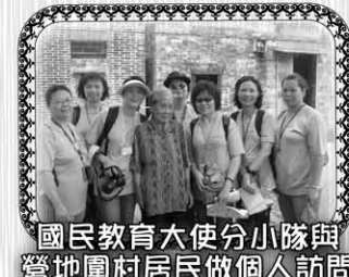
國民教育大使分小隊與 營地圍村居民做個人訪問