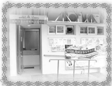
家庭及青少年服務支援中心 (位於沙角邨雲雀樓)