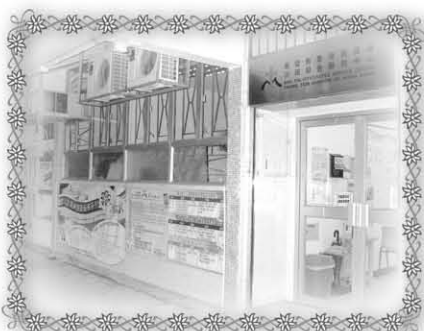
本中心正門 (位於博康邨博達樓)