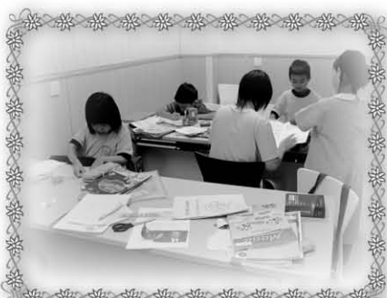
家庭及青少年服務支援中心 (小學功課輔導班)