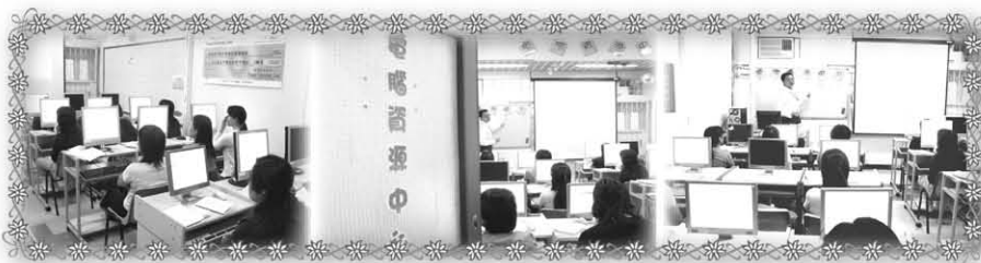
電腦資源中心 (位於博康邨博達樓)

中心按照服務表現監察制度中服務質素標準9 (SOS9) 指引，制定有關颱風與暴雨期間中心服務之安排：