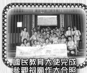
國民教育大使完成 參觀祠廟作大合照