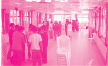
6/12/06 一群參與自信心訓練工作坊的中學生，正在嘗試以自己的方法，透過群策群力去解決困難，完成任務突破自我!!