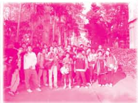
今年共有三十多位同學參與共創成長路(第二層培育活動)。