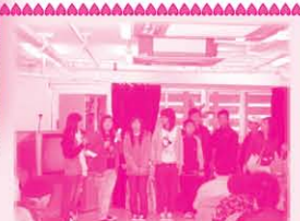
第三次活動是義工服務，同學由籌備到服務，都是由他們一手一腳，連司儀和主持遊戲都是他們一手包辦，同學其實很棒啊！