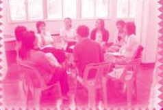
老師們輕鬆地分享工作上遇到的壓力