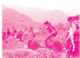
同學在遠足過程中，互相扶持，除學習到堅毅的意志，更體會到互相幫助的精神。