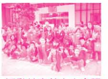
活動結束前之大合照

本年度繼續協助聖公會主風小學及保良局朱正賢小學推行校本課後學習及支援計劃(區本計劃)。於去年底，本中心為保良局朱正賢小學舉行戶外專題研習活動，內容主要透過參觀香港文化博物館進行專題研究，讓同學們認識香港的歷史和文化，增加他們對沙田區之歸屬感。