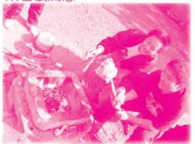
同學在原野烹飪中，很有創意地炮製「鹽烤雞」似模似樣，更找到樹枝作烤具