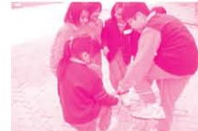
參與同學正進行集體活動