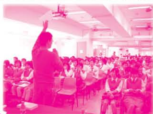
講座中同學都留心學習戀愛相處之道