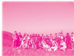
全級中二同學一起進行遠足訓練，為的是要鍛鍊堅強的意志和永不放棄的精神。