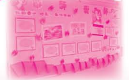
小五之組員為校園製作壁報，已表達向老師之敬意。