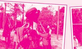
在第二次日營訓練中，同學開始進行高度合作性的遊戲，看同學非常合作啊！