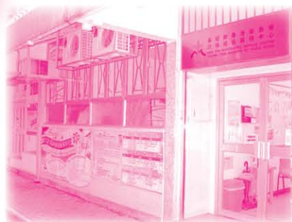
本中心正門 (位於博康邨博達樓)