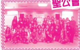
全體老師在酒店的會議室拍照留念