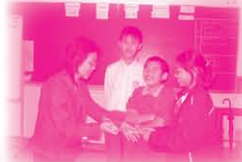
組員向老師致送小禮物。