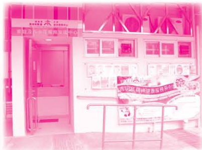
家庭及青少年服務支援中心 (位於沙角邨雲雀樓)