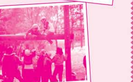
同學又要發揮團隊合作精神去挑戰橫樑啦。