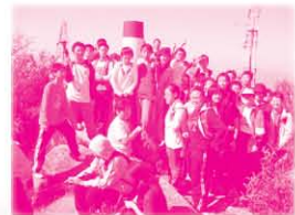
同學憑著堅毅的精神，終於挑戰西貢最高的山峰(石屋山481米)，看他們興奮的心情！