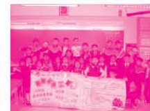
參與此活動之同學大合照

本年度我們與座落於九龍灣區的佛教慈敬學校舉行「非苦抗逆小戰士」活動，目的是為協助兒童面對成長中所遇到的困難，從而提升他們的自理能力，增加他們自信心。內容主要有7個單元篇，包括技能篇、情緒篇、理財篇、青春期護理篇、口才篇、營養篇、宿營篇。此活動參加者剛完成第三個單元篇，並通過是次考核獲發合格證書。