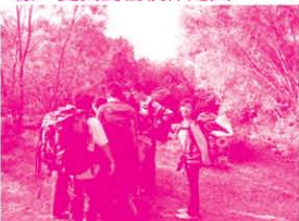
同學在野外定向中，一起研究地圖指南針，看看如何找到正確路線。