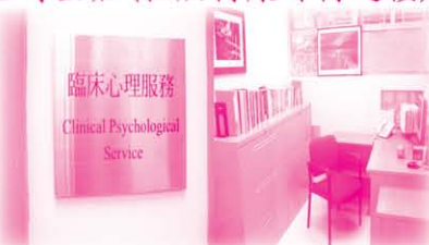
臨床心理服務 (附設於本中心)