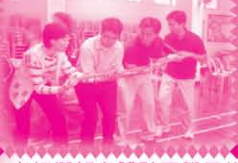
老師們親身體驗同學日後將會進行的歷奇遊戲