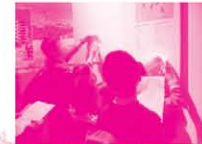
參與同學正搜尋香港的歷史文化。