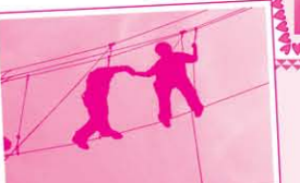
在高綽陣的挑戰中，同學除了考驗個人的自信外，更要考驗同學間的互信。