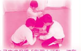
為了完成保護「雞蛋大行動」把雞蛋從二樓扔下而完好無缺，組員們正以有限物質包裹雞蛋以作保護。