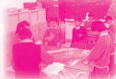
小五之組員在校籌備「敬師愛師」活動。