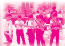
組員合作進行體驗遊戲「管管相傳」