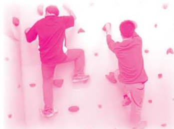
歷奇山莊(位於博康邨博達樓)