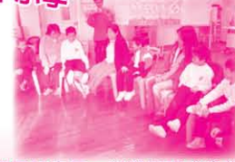
組員及家長一起進行講求合作性的體驗遊戲「傳水盆」。