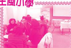
老師們正在分組討論日常教學時所遇到的壓力