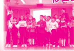
在校長的帶領下，組員在家長的見證下進行宣誓儀式。