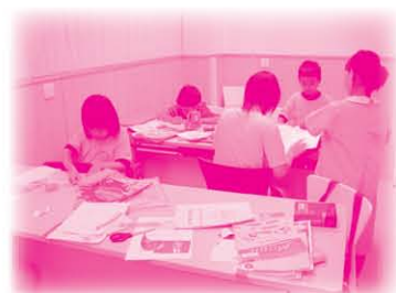
家庭及青少年服務支援中心 (小學功課輔導班)