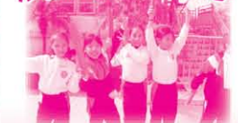
組員完成活動後，表現興奮