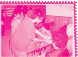
遊戲完畢，同學將親手包的禮物送給長者，充份發揮關懷長者的精神。