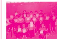
能通過理財篇考核的同學獲發合格證書。