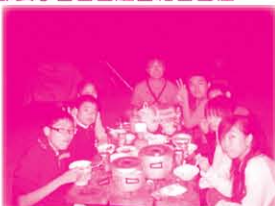
同學們更要學習自己煮晚餐，他們都是首次在野外煮食，看來也很滿意。