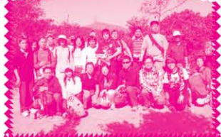
義工協助失明人士進行遠足郊遊活動，看他們打成一遍，充份表現社區共融的精神。