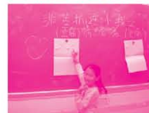
參與同學分辨正面負面情緒