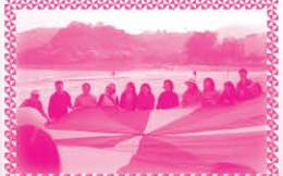
老師們正在海灘進行彩虹傘這個講求團隊合作的歷奇活動