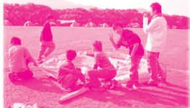
第二次訓練是野外露營，同學們都要學習自己起營給自己住。