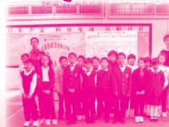
組員們完成活動後來一張大合照