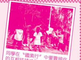
同學在「鐵索行」中要靠彼此的互相扶持才能完成任務。