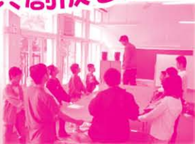
同學在首次的日營訓練中便嘗試挑戰個人膽色和同學的互信，看來兩樣都有很有信心。