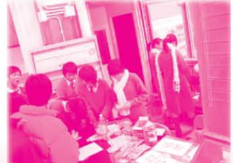
午膳時間更有以戀愛為主題的攤位遊戲，同學們都踴躍參與。