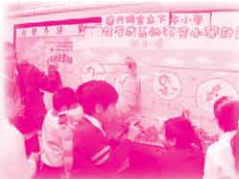
組員們合力完成一幅象徵本年度活動正式展開的拼圖，並在上圖簽名。