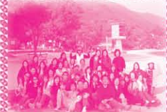
在海灘的全體大合照