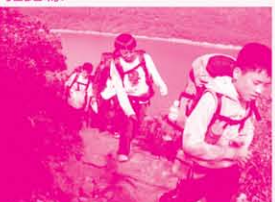
找到路了，一起出發。