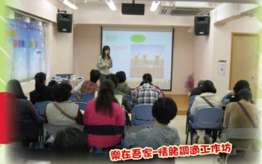
樂在吾家-情緒調適工作坊