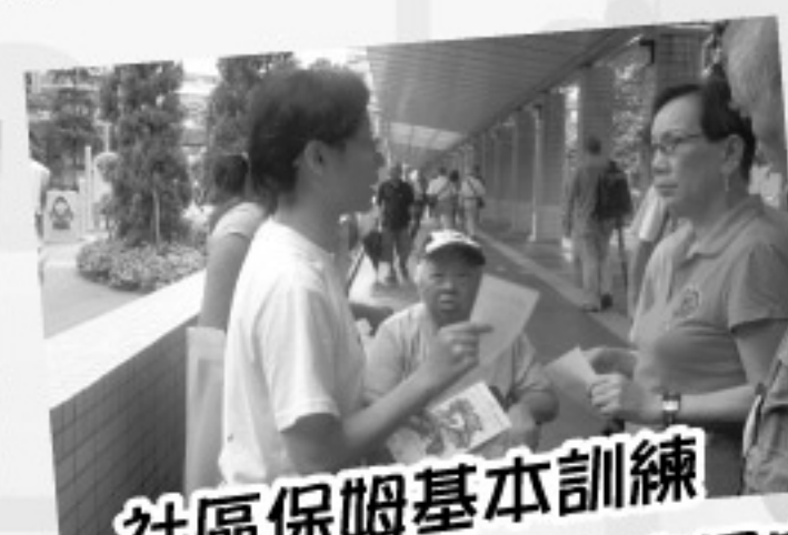
社區保姆基本訓練 進階訓練—幼兒家居安全及 危機處理面觀