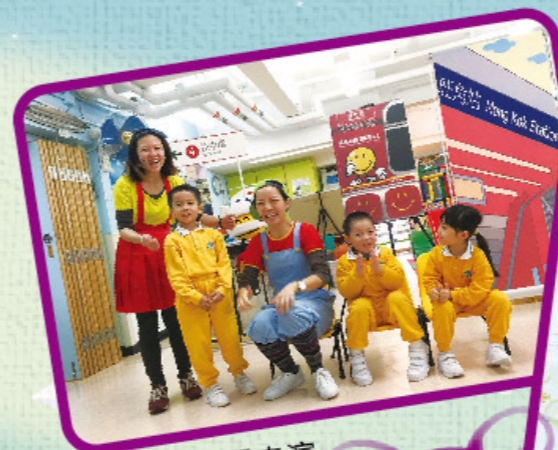
港鐵x香港話劇團表演 《鐵路安全之達人》