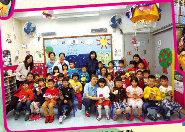
社區媽咪親親你活動