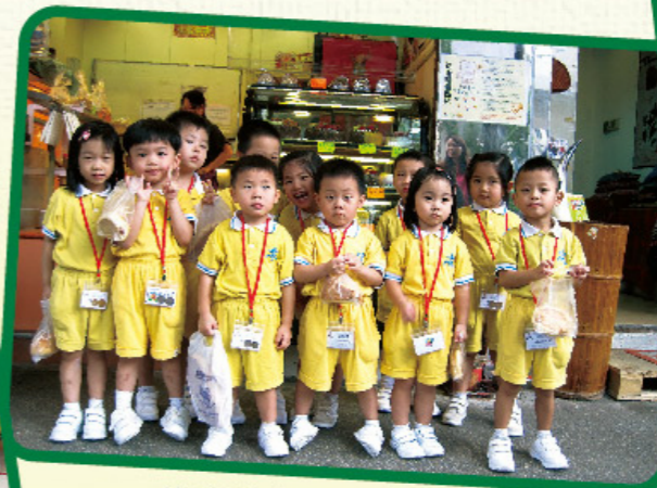
幼兒班參觀麵包店