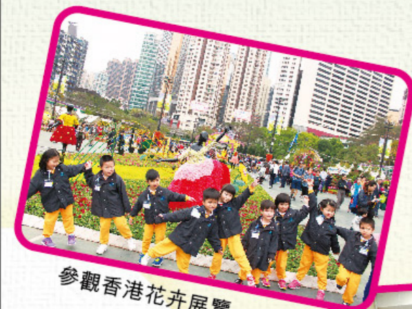
參觀香港花卉展覽