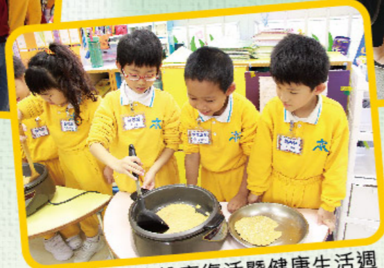
五彩繽紛慶復活暨健康生活週