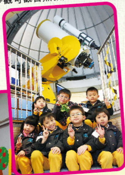
參觀可觀自然教育中心暨天文館