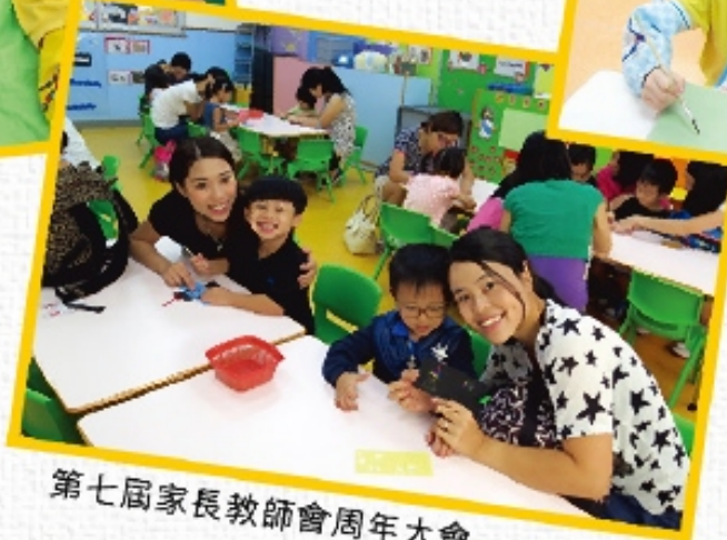
第七屆家長教師會周年大會