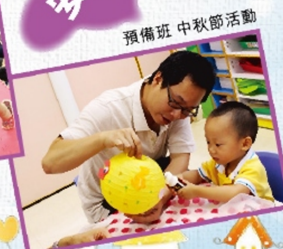
預備班 中秋節活動