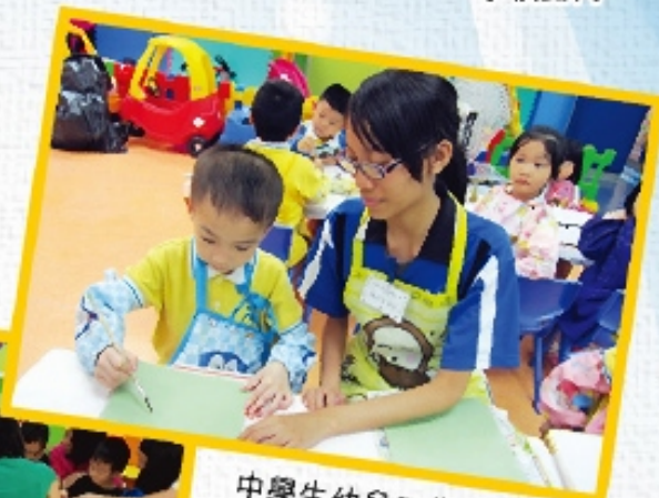
中學生幼兒工作體驗計劃2014