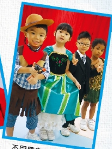
不同國家服飾,時裝表演