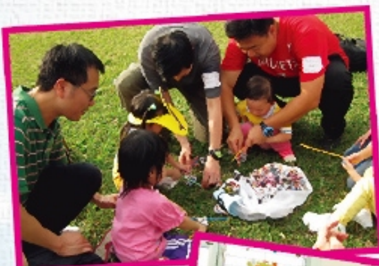
聯校親子旅行活動