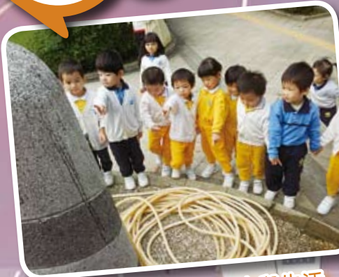
低班設計活動 — 水與生活