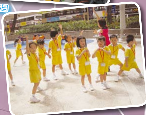
高班到公園探索影子