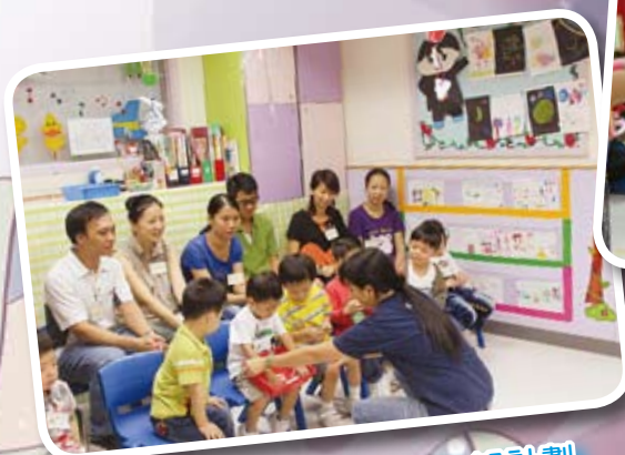
蘋果基金—「童」創GOAL峰計劃