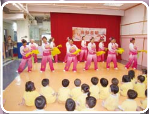
「舞動耆積」福康長者到訪學校