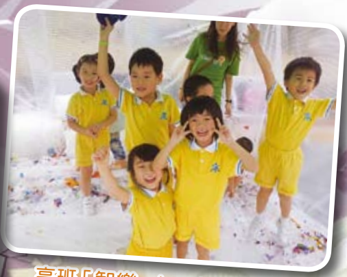
高班「智樂 play for all 遊戲日」