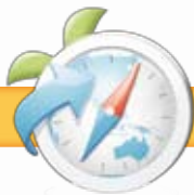
低班-參觀陽光笑容小樂園