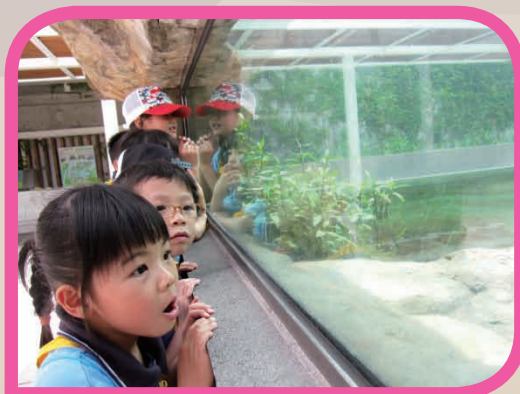
「小蜜蜂」參觀濕地公園