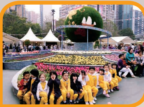
低班參觀維園花展