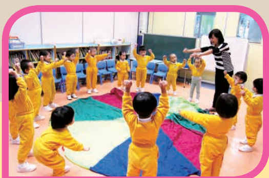
社工帶領幼兒進行「關愛社交」活動