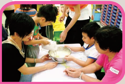
「安全廚房教室」親子甜品製作