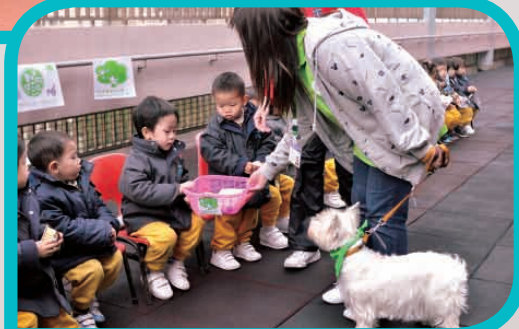
「動物特工隊」到訪學校推廣環保意識