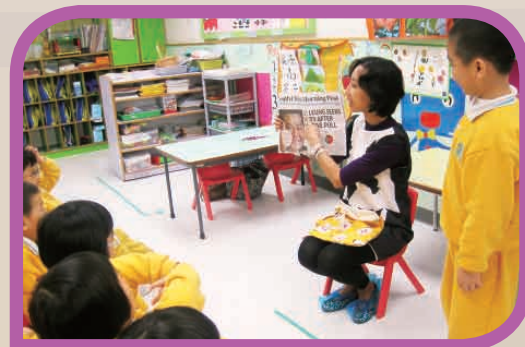
「親親孩子天」- 姨姨到訪講故事