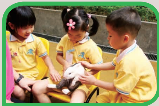
低班設計活動 - 兔子