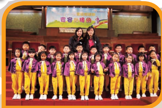
高班聖經朗誦比賽