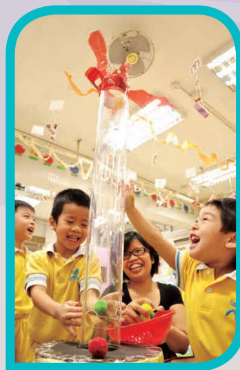
親子一同參與「智樂遊戲工作坊」