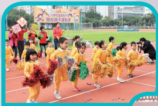
「聯校親子運動會」親子一同參加啦啦隊表演