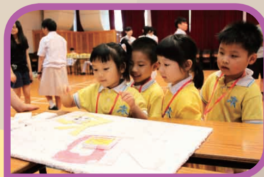
低班學生參與中學哥哥姐姐設計環保遊戲