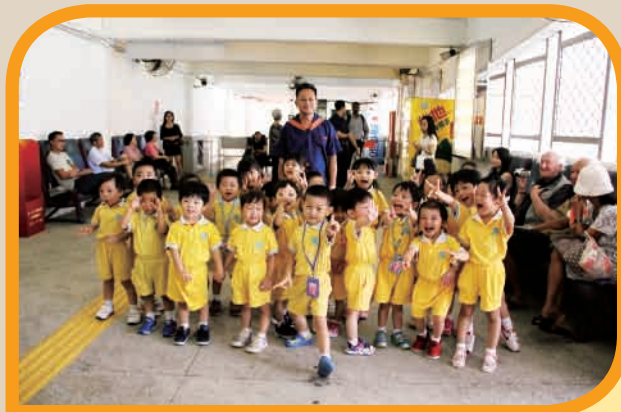
幼兒班乘坐渡海小輪