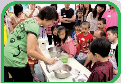
「安全廚房教室」親子甜品創作