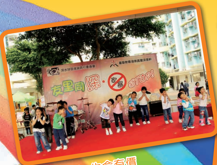
社區推廣日-生命有價