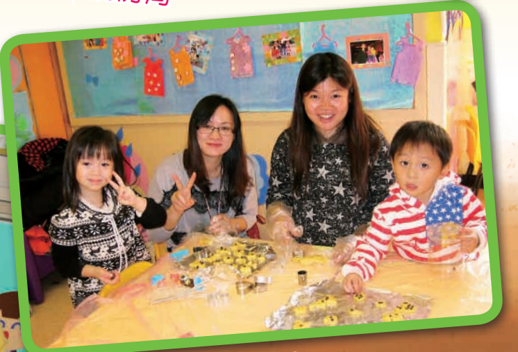
家教會愛心曲奇活動