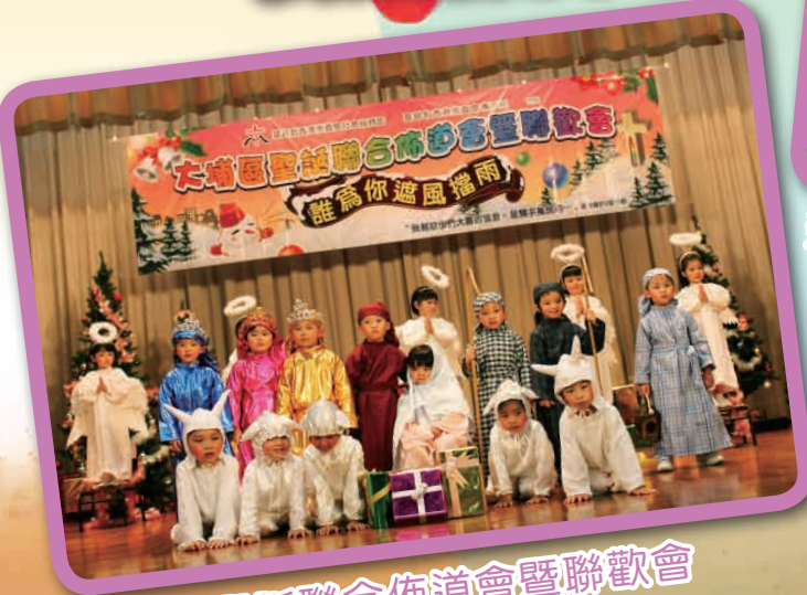
大埔區聖誕聯合佈道會暨聯歡會