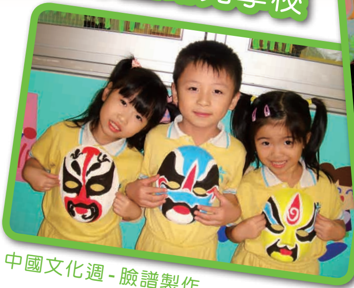
中國文化週 - 臉譜製作