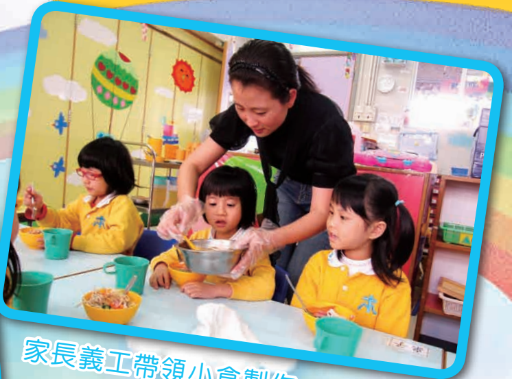
家長義工帶領小食製作