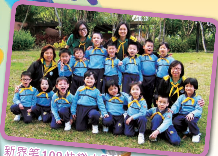
新界第109快樂小蜜蜂隊