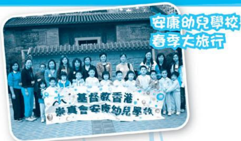
安康幼兒學校 春季大旅行