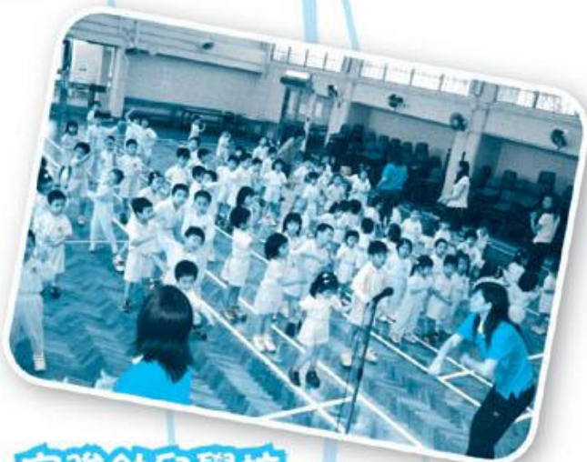
安強幼兒學校 跳出舞動sha la la