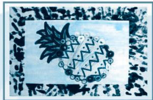
主題：鳳梨 學生姓名：李紹熙 班別：低班 安康幼兒學校