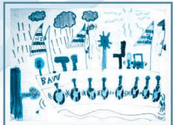
主題：渡海小輪 學生姓名：林俊軒 班別：高班 安強幼兒學校