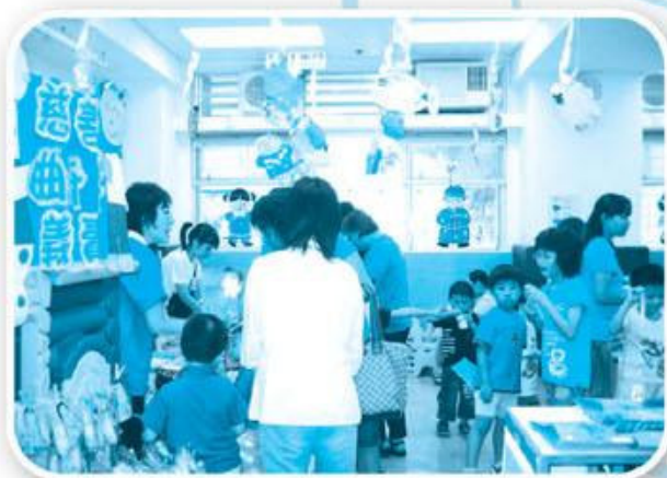
安怡幼兒學校 開放日 8.5.20親子王國