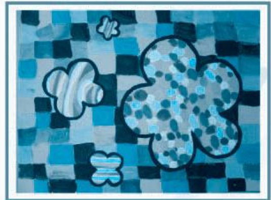
主題：花花世界 學生姓名：李浣雯 班別：高班 安基幼兒學校