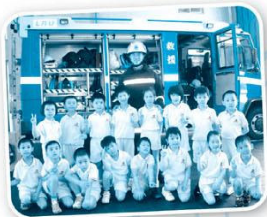
安基幼兒學校 參觀消防局