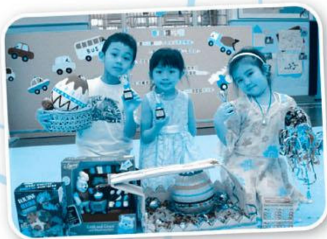
安仁幼兒學校 親子復活籃設計比賽