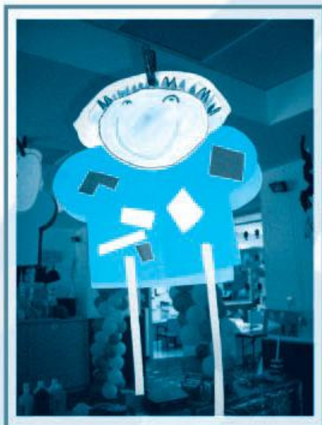
主題：風箏——我要高飛 學生姓名：李國豪 班別：中班 安怡幼兒學校